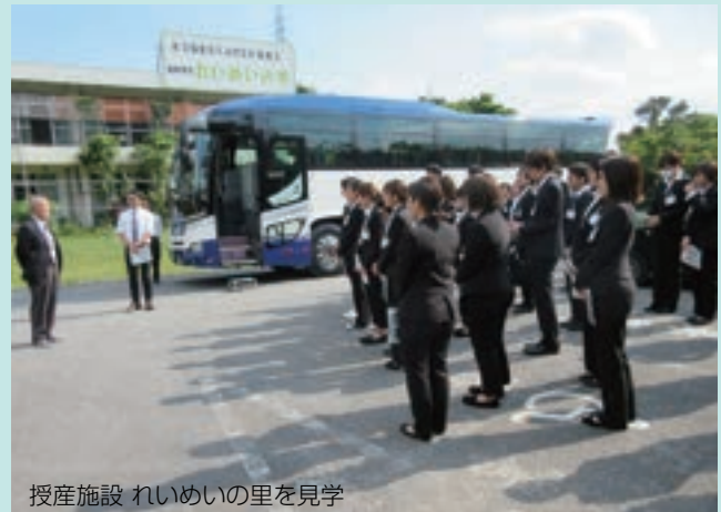
授産施設 れいめいの里を見学