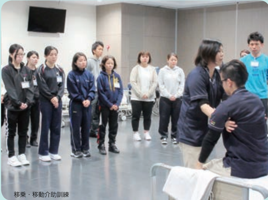
移乗・移動介助訓練