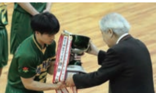
↑ ↓ 12月 全日本9人制バレーボール実業団選抜男女優勝大会(櫻田記念大会) 優勝