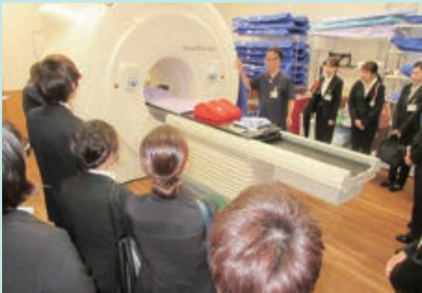
最新鋭放射線治療システム・トモセラピーを見学 (南部徳洲会病院にて)