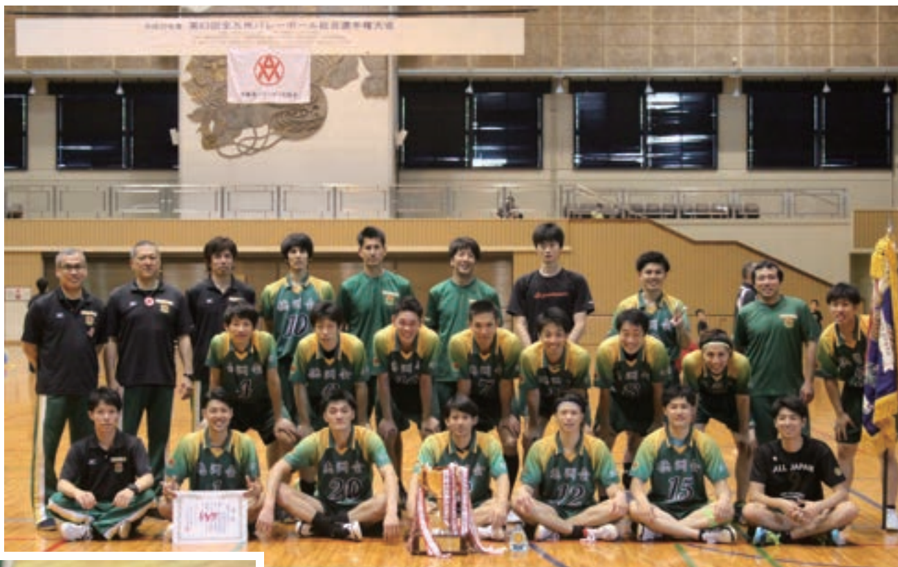
↑ ↓ 5月 第63回全九州バレーボール総合選手権大会 優勝

ずれも2-0のストレートで全試合1セットも落とすことなく、大会16連覇を成し遂げました。この大会で平成30年度の日程は全て終了し、今年度は、全国大会優勝2回、準優勝1回、九州大会優勝2回という成績を残すことができました。2019年度は更に良い成績を目指して努力してまいりますので、皆さんの応援をよろしくお願いたします。