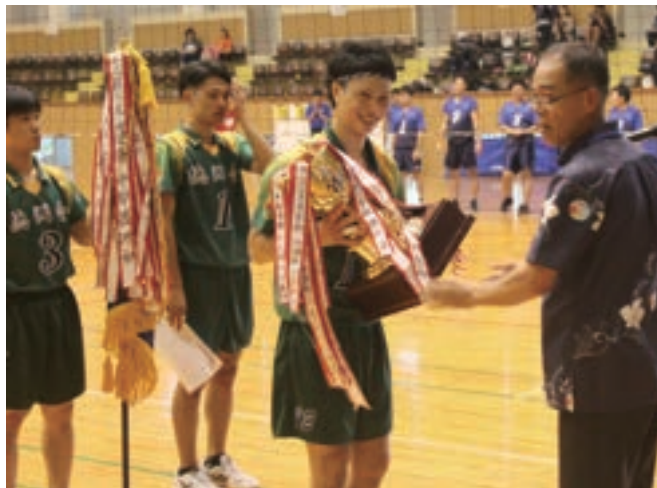
10月 第4回全日本9人制バレーボールトップリーグ(V9チャンプリーグ) 優勝