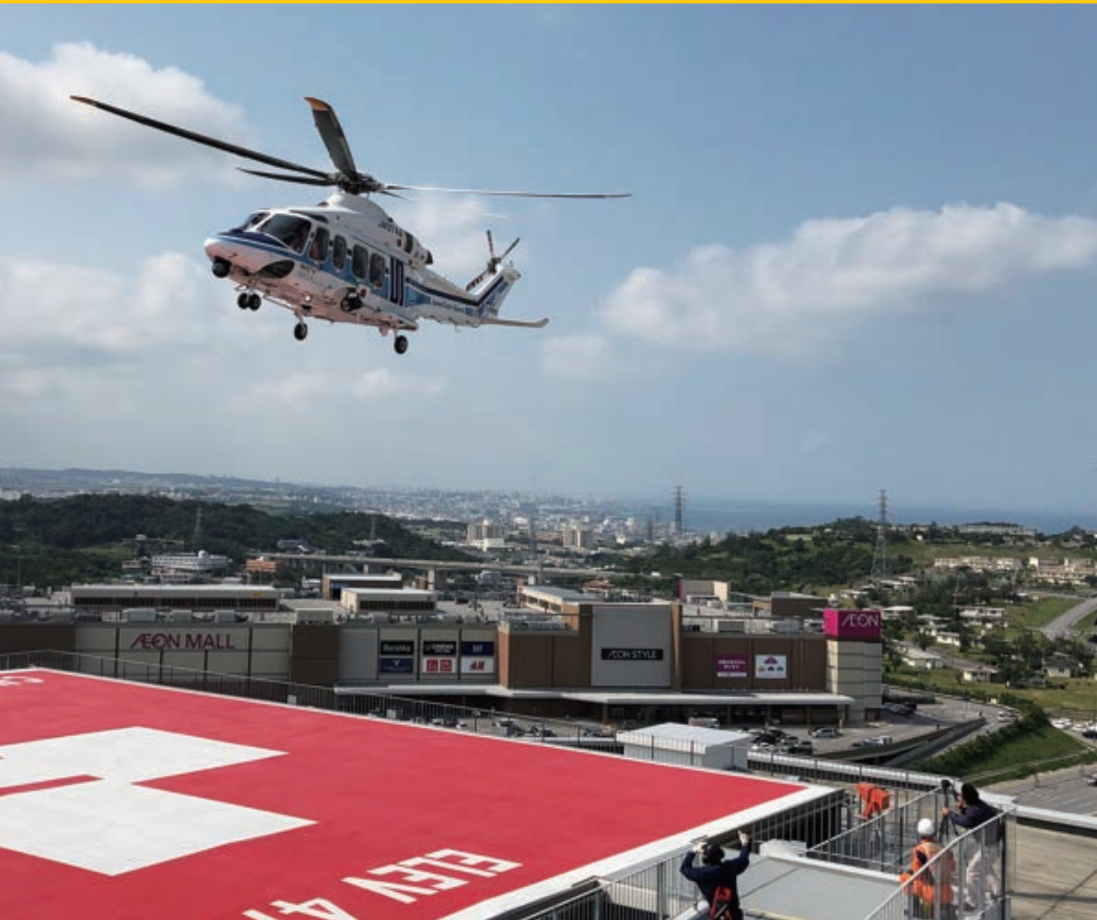
海上保安庁 救助ヘリ離発着訓練

中部徳洲会病院 ☎ (098) 932-1110 ソフィアクリニック ☎ (098) 923-2110 徳洲会ハンビークリニック ☎ (098) 926-3000 与勝あやはしクリニック ☎ (098) 983-0055 よみたんクリニック ☎ (098) 958-5775 徳洲会新都心クリニック ☎ (098) 860-0755 おきなわ徳洲苑 ☎ (098) 931-1215 グループホーム美ら徳 ☎ (098) 931-1223 徳洲会伊良部島診療所 ☎ (0980) 78-6661 宮古島徳洲会病院 ☎ (0980) 73-1100 石垣島徳洲会病院 ☎ (0980) 88-0123 北谷病院 ☎ (098) 936-5611