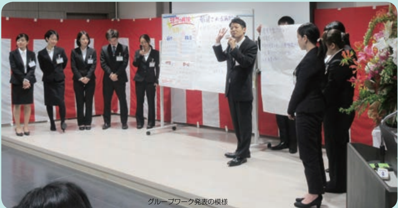
グループワーク発表の様