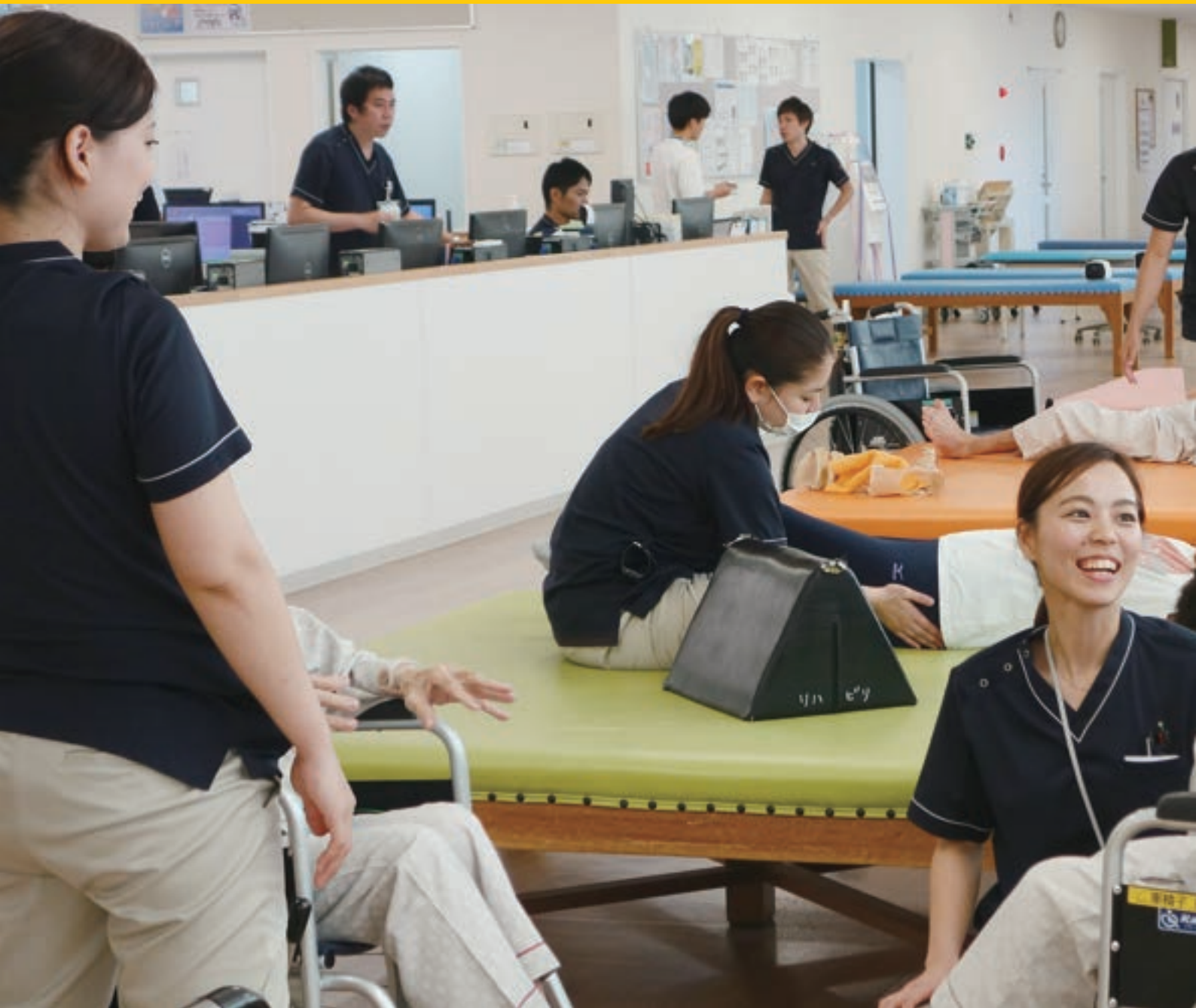
リハビリテーションセンター