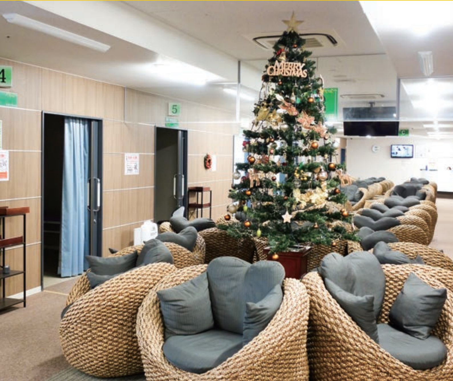
健康管理センターにて

中部徳洲会病院 ☎ (098) 932-1110 ソフィアクリニック ☎ (098) 923-2110 徳洲会ハンビークリニック ☎ (098) 926-3000 与勝あやはしクリニック ☎ (098) 983-0055 よみたんクリニック ☎ (098) 958-5775 徳洲会新都心クリニック ☎ (098) 860-0755 おきなわ徳洲苑 ☎ (098) 931-1215 グループホーム美ら徳 ☎ (098) 931-1223 徳洲会伊良部島診療所 ☎ (0980) 78-6661 宮古島徳洲会病院 ☎ (0980) 73-1100 石垣島徳洲会病院 ☎ (0980) 88-0123 北谷病院 ☎ (098) 936-5611 ちゅうとく訪問看護ステーション ☎ (098) 939-9766 ちゅうとく居宅介護支援事業所 ☎ (098) 939-9768