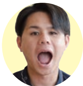
口を大きく開ける