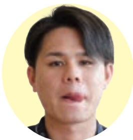
舌先を唇にそって回す